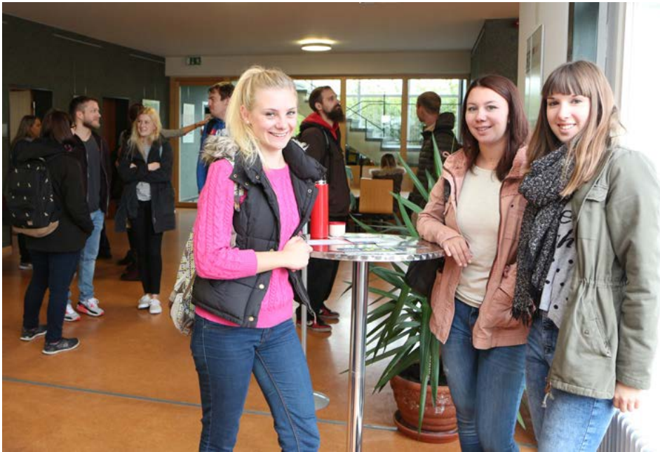
Einige Erstsemester der Studiengänge Soziale Arbeit vor Beginn ihrer Begrüßungsveranstaltung.

Das neue Studienjahr hat begonnen und das erneute Ansteigen der Studierendenzahlen belegt, dass ein duales Studium gefragt ist.