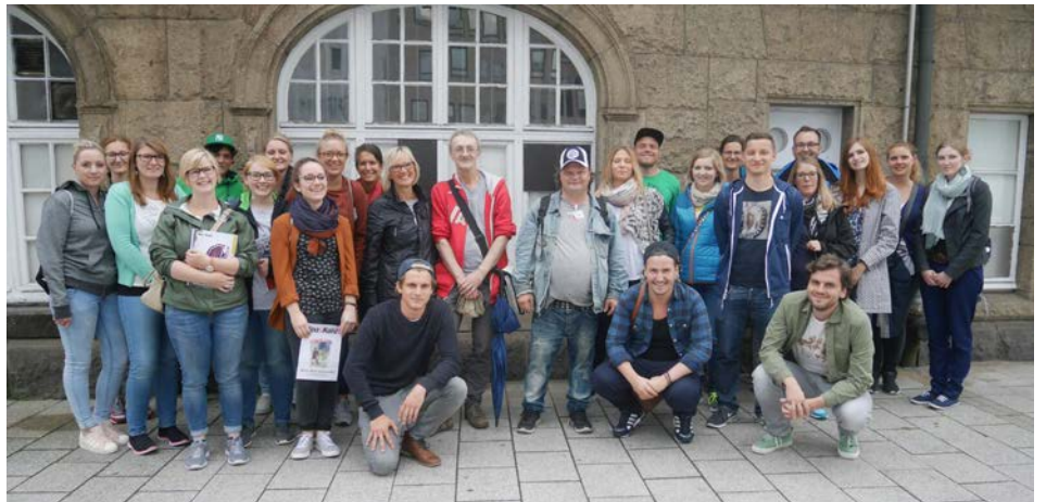
Die Studienfahrt bot auch eine Stadtbesichtigung mit einem Mitarbeiter der Zeitung Hinz&Kunzt , einer Initiative für Menschen ohne Obdach.

Der Besuch einer stationären Einrichtung für Menschen mit hirntraumatischen Folgestörungen wiederum zeigte, dass neben Sozialer