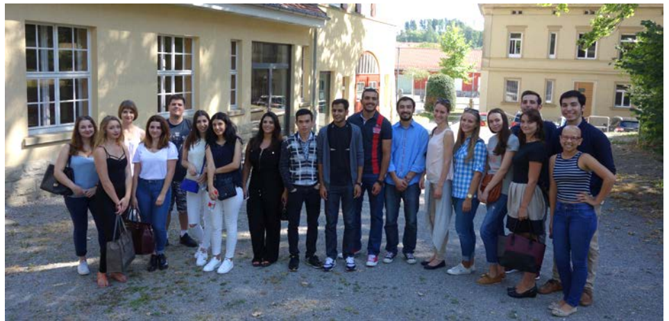
Diese Gruppe internationaler Studierender verbringt einen Studienaufenthalt an der DHBW VS.

Im September hat die Studienakademie 19 Studierenden aus neun Ländern im Rahmen einer Orientierungswoche die Gelegenheit geboten, den Hochschulstandort näher kennen zu lernen und sich auf ihr Studium und ihren Aufenthalt in Deutschland einzustimmen. Begrüßt wurde die Gruppe von Angela Brusis, der Auslandsreferentin im International Office.